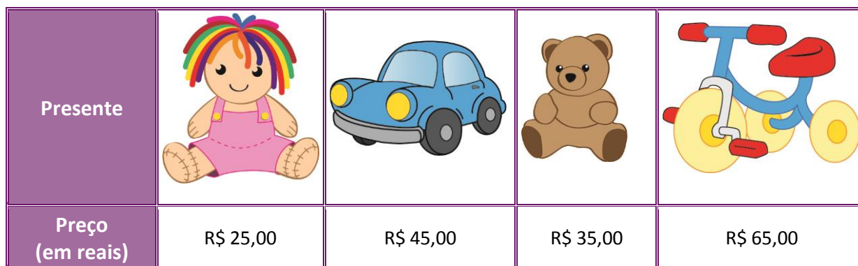
Tabela elaborada para fins didáticos.

As imagens não estão representadas em proporção.