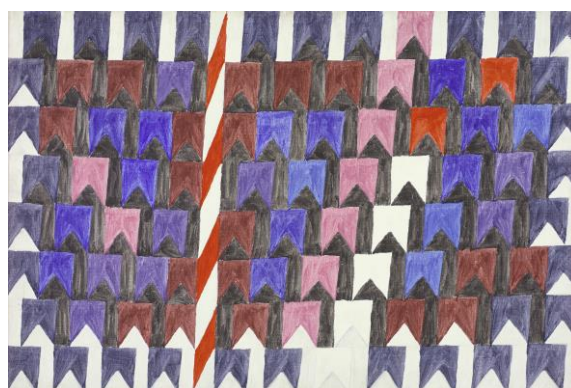
Bandeiras e mastros