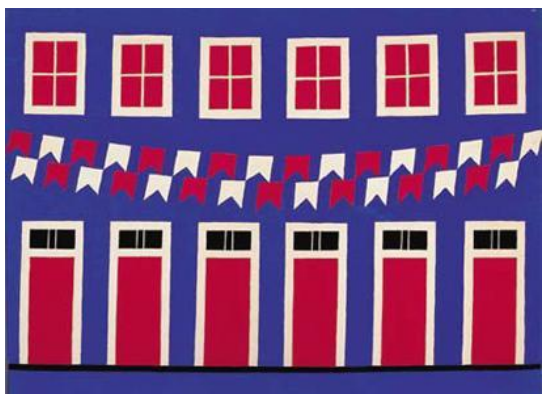
"Grande Fachada Festiva", do italiano Alfredo Volpi.

Fez também, bonitas pinturas retratando santos em igrejas e também no palácio do Itamaraty, em Brasília. O Alfredo ganhou muitos prêmios pelos seus quadros, tanto aqui no Brasil, como na Itália e Nova York.