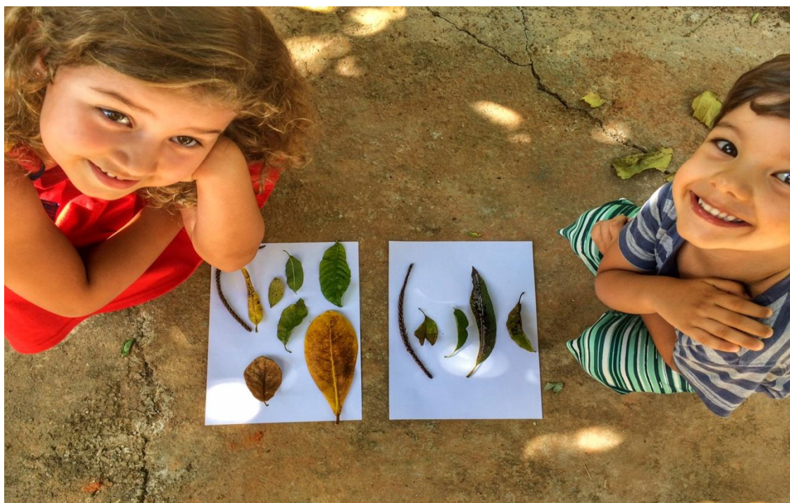
Foto: Colagem com elementos da natureza ( https://napracinha.com.br )

Procure folhas secas bonitas que caíram das árvores e contem para a mamãe como elas são, é só marcar com um x: