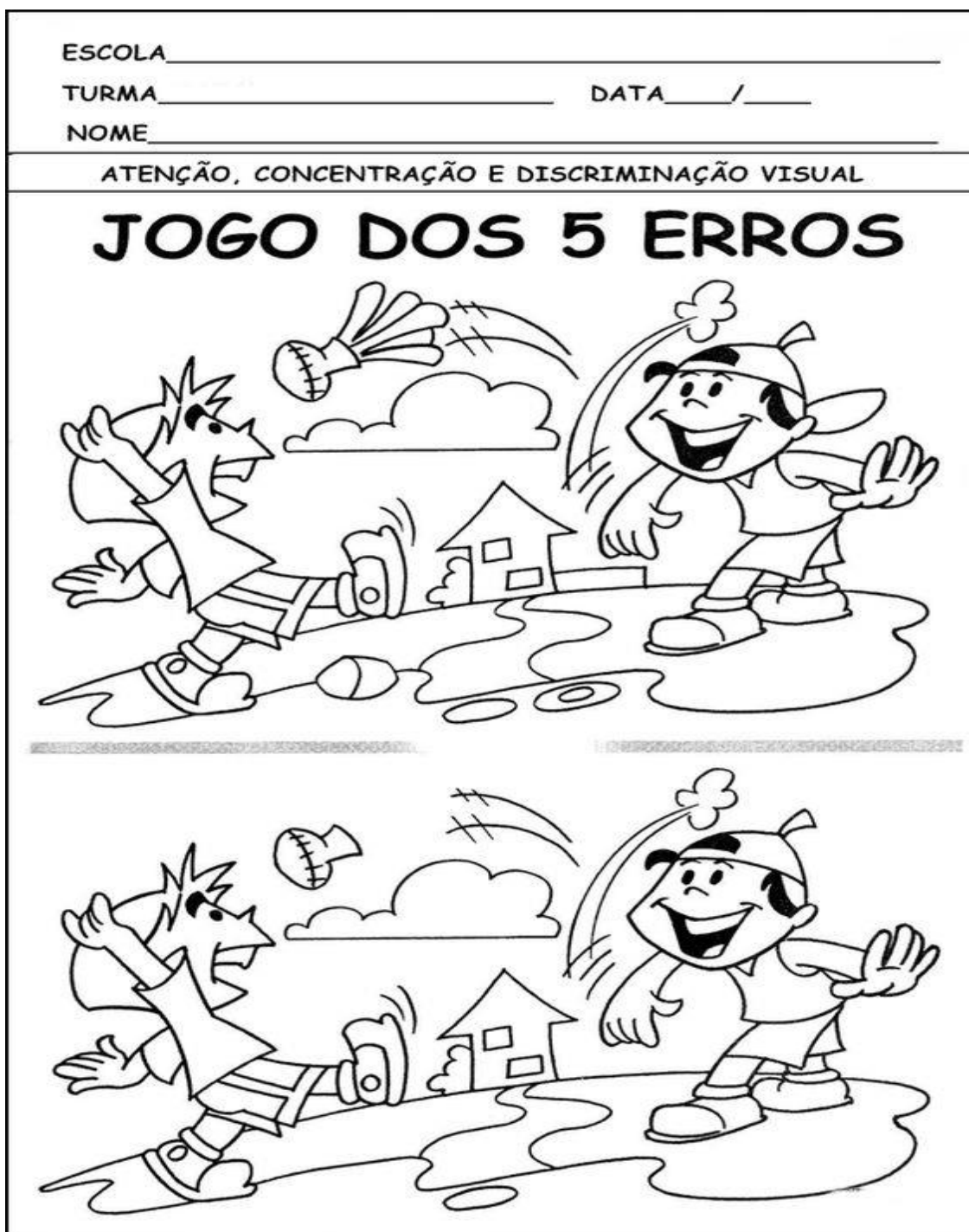
Imagem e foto via whatsapp (Pinterest)

Campo de Experiência: “CORPO, GESTOS E MOVIMENTOS”