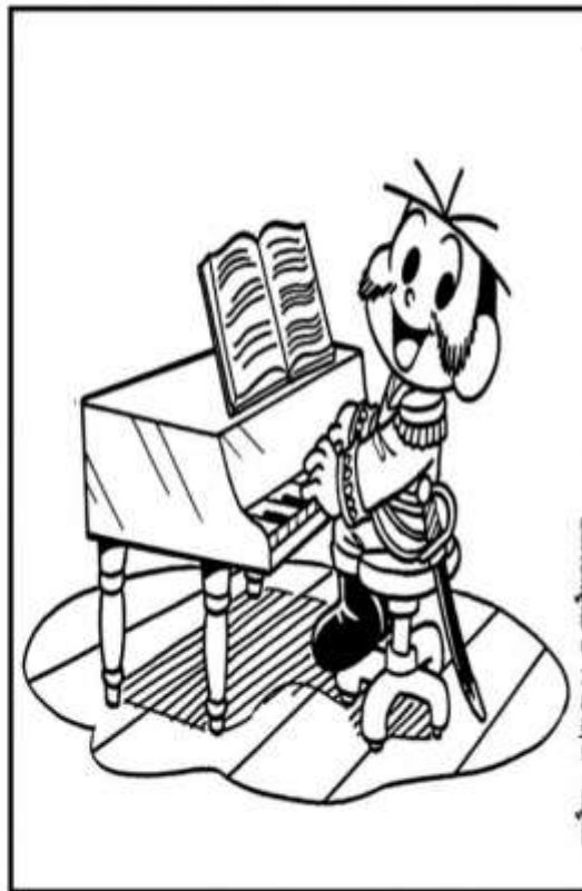
Educação e Transformação