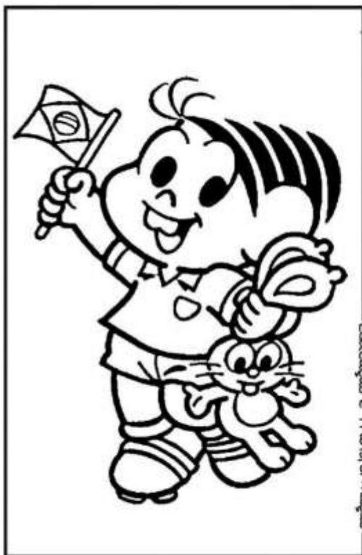
Educação e Transformação

A Independência do Brasil é um dos fatos históricos mais importantes de nosso país, pois marca o fim do domínio português e a conquista da autonomia política. Muitas tentativas anteriores ocorreram e muitas pessoas morreram na luta por este ideal. Podemos citar o caso mais conhecido: Tiradentes. Foi executado pela coroa portuguesa por defender a liberdade de nosso país, durante o processo da Inconfidência Mineira.