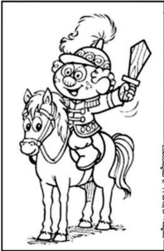
Educação e Transformação