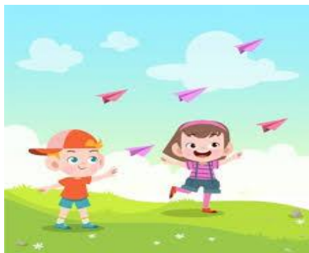
AVIÃOZINHO DE PAPEL