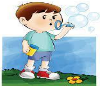
BOLINHA DE SABÃO