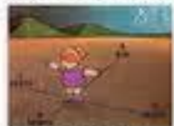
Cruzeiro do Sul

O desenho ao lado é de uma bússola, um aparelho que contém uma agulha imantada que sempre está indicando a direção Norte. A bússola é utilizada em aviões, em navios, por viajantes, para determinar as direções a serem seguidas.