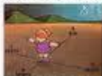
Cruzeiro do Sul