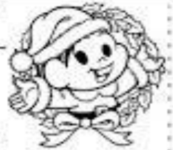
GRÁFICO DO PAPAI NOEL

O PAPAI NOEL COLOCOU OS BRINQUEDOS NO TRENÓ PARA ENTREGAR NO NATAL PARA AS CRIANÇAS. VEJA COMO FICOU.