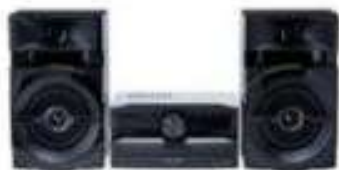
Mini System, Panasonic R$ 459,00