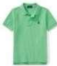
Camiseta Polo R$ 69,50