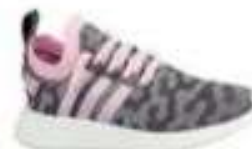
Tênis Adidas R$ 249,50